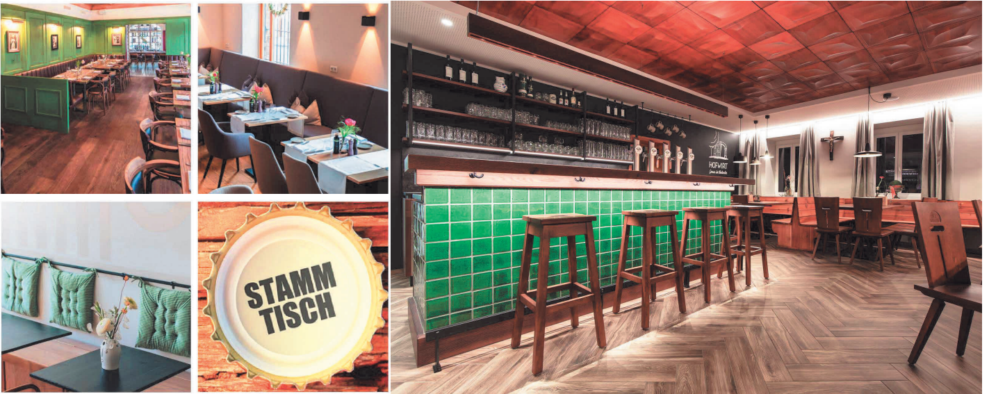
Referenzfotos (Hofwirt in Michaelnbach)

Ausgewählt Fotos im Workshop der „Frauen“